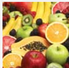
Lunch, fruktmingel översraskningar mm