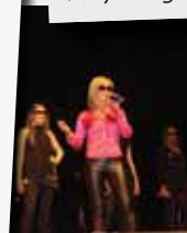
rasjon10 i Oslo