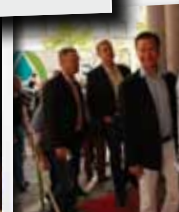
Glada miner i kön